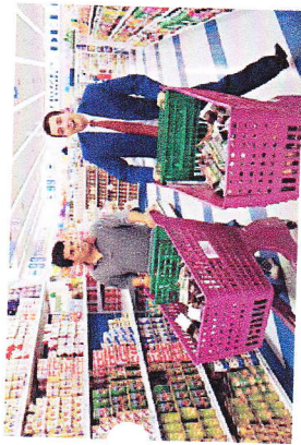
Punch-Drunk Love Paul Thomas Anderson VS, 2002

Een romantische komedie en een deprimerend tijdsbeeld. Geluk en gekte gaan hand in hand, net als liefde en pech. In de wereld van Paul Thomas Anderson zit zelfs een kabbelend bestaan vol verrassingen.