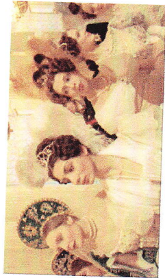
Russian Ark Aleksandr Sokolov Rusland, 2002

Op een adembenemende reis (in één anderhalf uur durende take!) door de Hermitage in Sint Petersburg ontmoet een 19 e eeuwse diplomaat talrijke historische en gedroomde figuren uit de Russische geschiedenis.